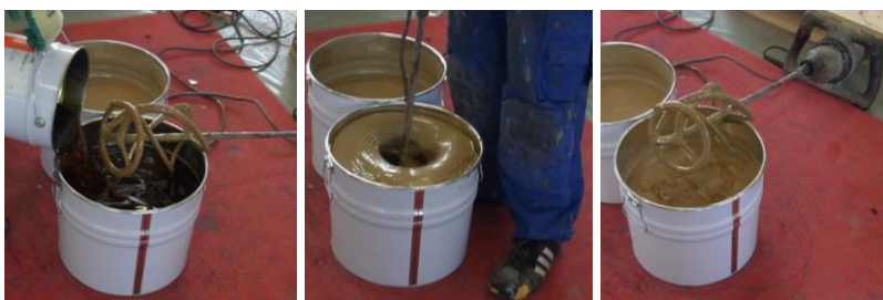
Mélange de l'adhésif PU bi-composant

Le revêtement de sol est fourni en rouleaux qui doivent être stockés pendant 1 à 2 jours à une température de 15 à 25 °C pour s'acclimater à l'endroit où ils seront posés. La veille de l'installation, déroulez le revêtement de sol sans le coller afin que les rouleaux individuels puissent se détendre. Mélangez les deux composants de l'adhésif avant la pose. Immédiatement après le mélange, verser uniformément tout le contenu du seau de colle sur la surface de pose préparée (environ 0,7 kg/m 2 de colle SPORTEC 700 2K-PU ) afin qu'il ne reste aucun résidu de colle dans le seau.